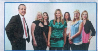
Ihr Team der Steuerberatungsgesellschaft KWT - Kislinger & Partner